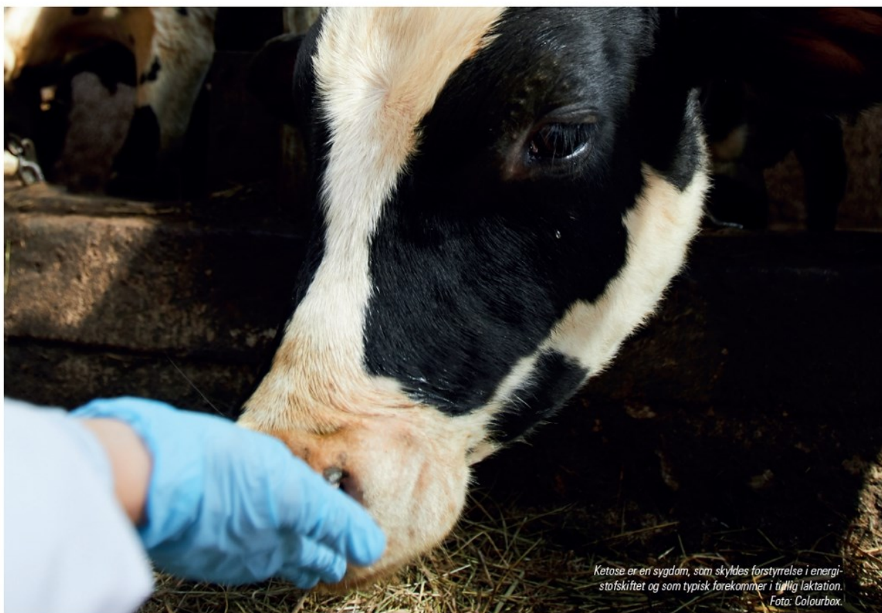
Ketose er en sygdom, som skyldes forstyrrelse i energistofskiftet og som typisk forekommer i tidlig laktation.